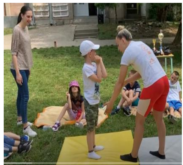
7. Ритуали у пројекту „Бавите се спортом“