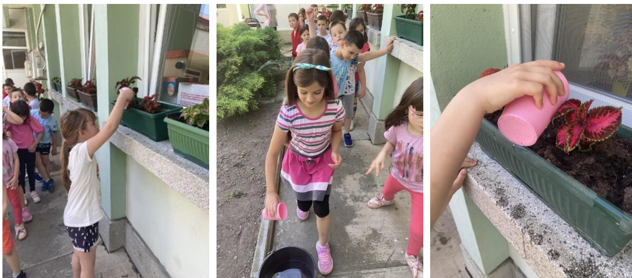
11. Аутентичне ситуације – заливање биљака

Биљке које красе вртић, потребно је редовно неговати и заливати како би што дуже трајале. Деца из старијих и група пред полазак у школу током радне недеље деле задужења заливања биљака. На тај начин они показују заинтересованост за очување биљног света, као и очувања животне средине.