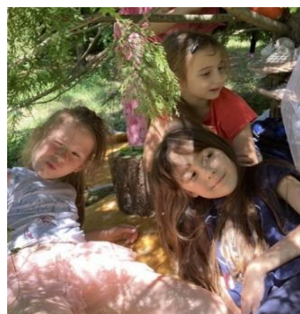
6. Свакодневне рутине деца претварају у игру