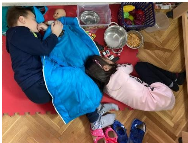
26. Просторна целина за симболичку игру понекад постаје модна писта или простор за разноврсне животне ситуације које деца „живе“

На основу посматрања деце у просторној целини за симболичку игру настало је и питање којим се бави овај рад. „Колико је развијен сценски израз предшколске деце у просторној целини за симболичку игру?“ Праћењем игре коју бирају деца, настала су промишљања васпитача да ли је простор довољно опремљен играчкама, материјалима и респловима, која су деца важна, како би игра могла да „живи“.