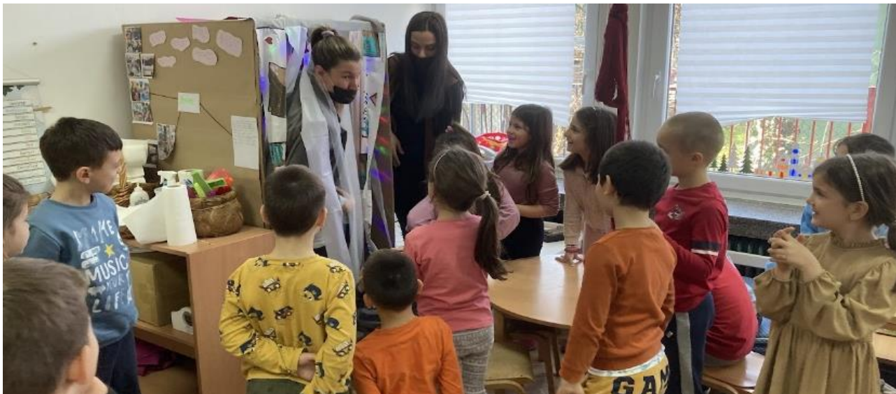
9. Ритуали добродошлице другим групама у наш простор за игру

Поред осмишљавања игре током празника, ритуал добродошлице показали су током уређивања радне собе и позвања другара из других узрастних група са својим васпитачицама да им покажу „нови“ простор за игру.