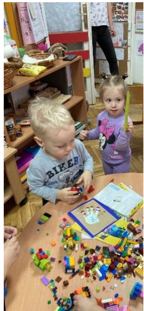
17. Посета млађих другара