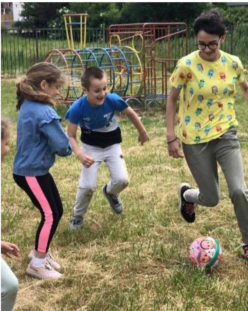
16. Посета старијих другара