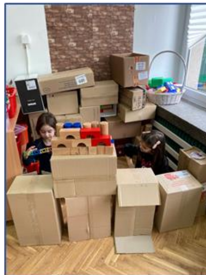
21. Кутије као значајна играчка

Да би дошли до заинтересованости деце, васпитач стално ради на провокацији дечје природне потребе за трагањем.