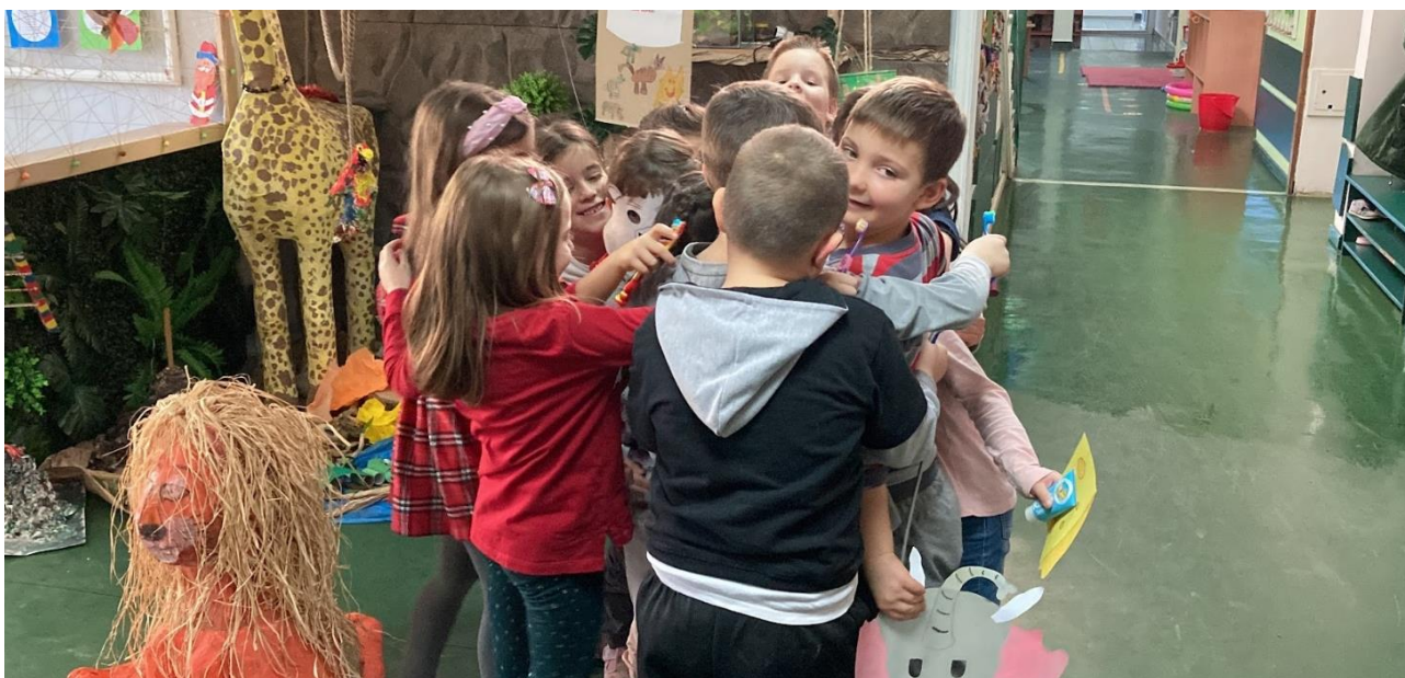
10. Ритуал прославе пројекта

Ритуали поздрава и завршавања заједничке игре, у којој се сви заједно загрле је слика на коју је сваки васпитач поносан, јер на тај начин деца показују радост, задовољство али и припадност групи у којој се налазе.