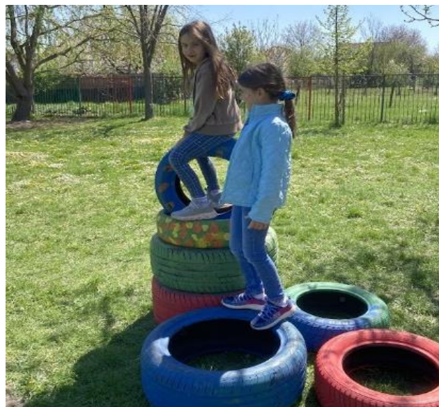
5. Аутомобилске гуме у игри постају све што желе