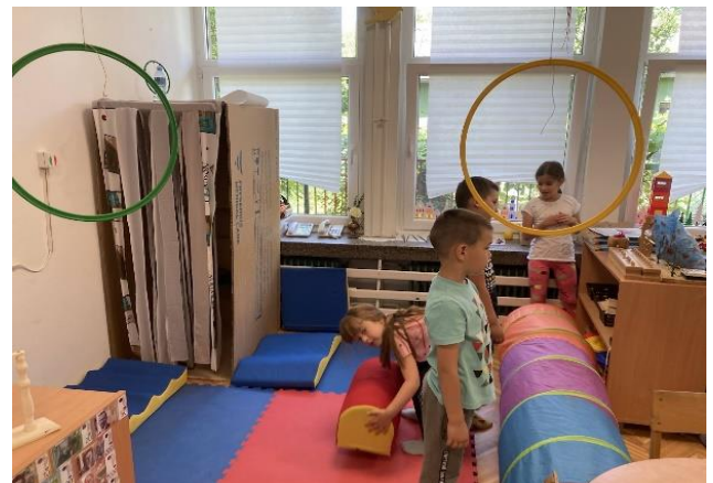
14. Аутентичне ситуације – реорганизација простора радне собе за нови пројекат „Бавите се спортом“