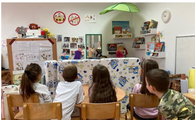
24. Просторна целина за симболичку игру

У оквиру радне собе у вртићу „Златокоса“ у Ветернику креирана је просторна целина за симболичку игру на основу дечијих интересовања и потреба.