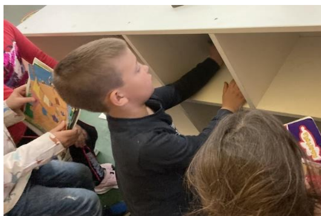
4. Рутине код уређења простора Сваког петка одржавање хигијене простора радне собе и заједничких простора