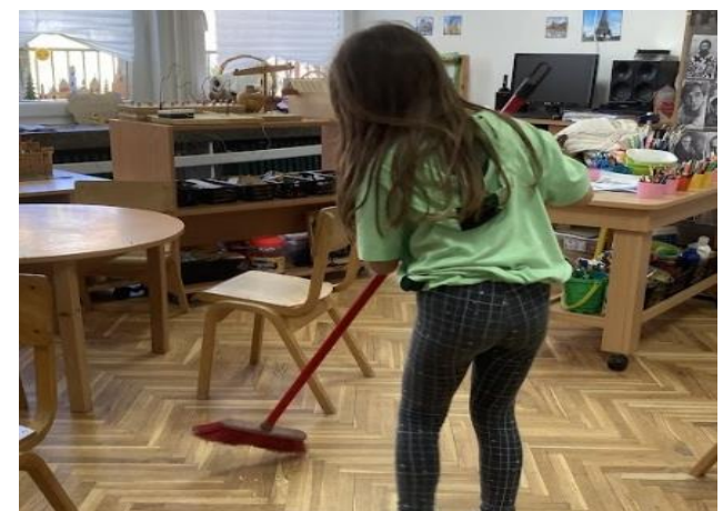
2. Свакодневне рутине у вртићу (припрема столова за оброк, постављање столова, прање зубића, прозивање у Књигу рада, брисање после оброка...)