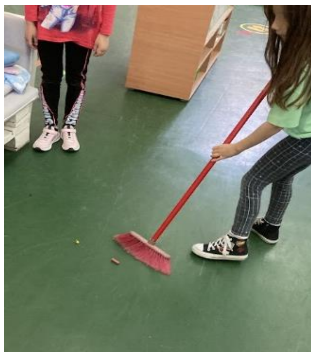
3. Уређење заједничког простора у вртићу - хола

Дечаци су се испрофилисали у раду са већим комадима намештаја, да их помере, наместе, не ретко и да их обришу и припреме за неку другу намену. На тај начин они су представили себе као једну снажну и јаку фигуру, попут њихових родитеља који обављају сличне послове у кући.