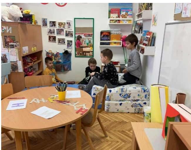
25. Дечаци креирају свој простор у игри

Било је разних предлога, мени је најдражи путак, али већина деце се сложила да ипак то буде дневна соба.