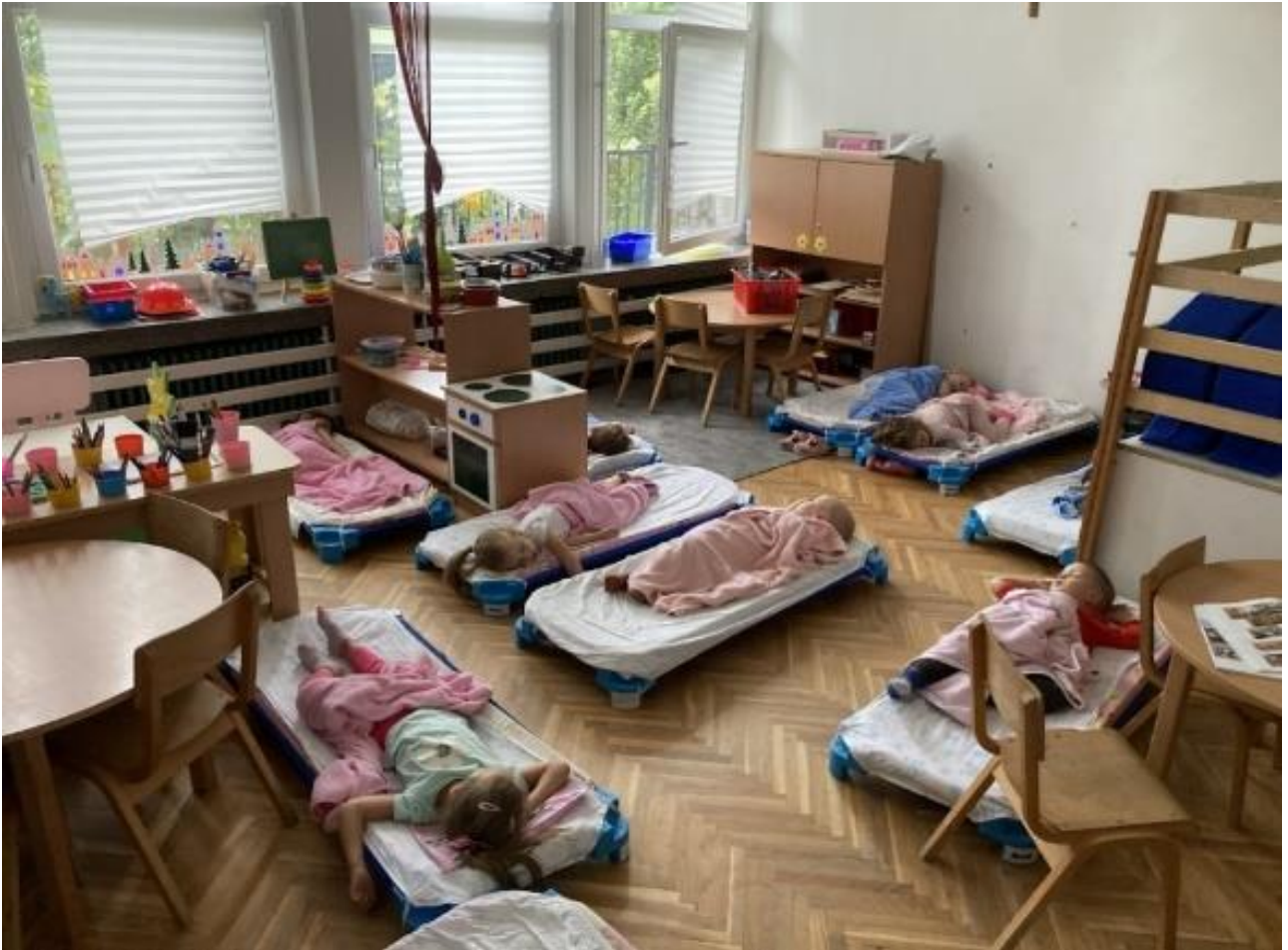
23. Радна соба у време одмора