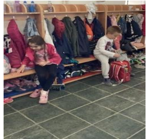
1. Свакодневне рутине деце у години пред полазак у школу у јутарњим часовима

Слично је и са припремом и постављањем стола пред оброке, као и одржавањем личне хигијене пре и после јела.