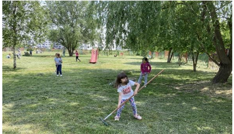
12. Аутентичне ситуације – уређење дворишта