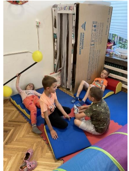
15. Уношење нових материјала и реквизита аутентичних за пројекат