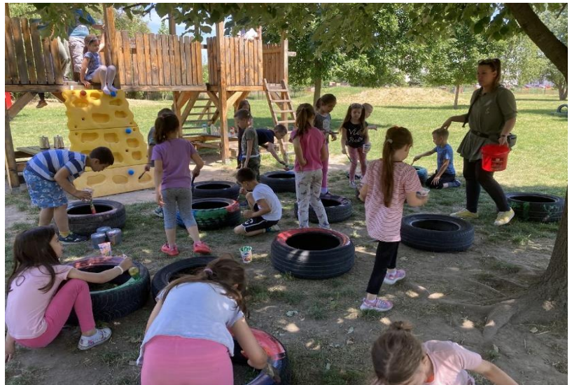
13. Аутентичне ситуације – фарбање аутомобилских гума